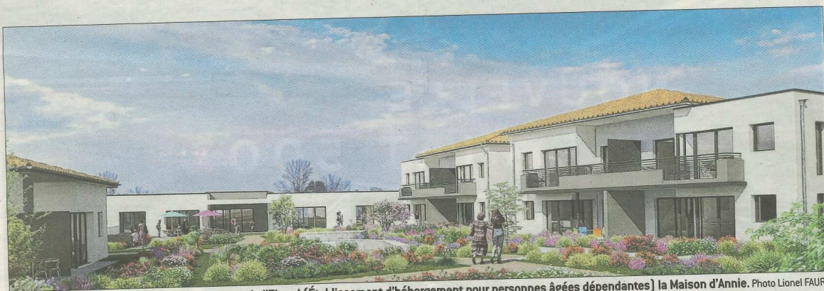
■ Le village est sorti de terre juste en dessous de l'Ehpad (Établissement d'hébergement pour personnes âgées dépendantes) la Maison d'Annie.