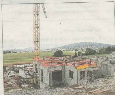
■ Les travaux se poursuivent pour une ouverture prévue à l'été 2019.

rapport à la proximité des services que vous pourrez développer grâce à la maison de retraite. »