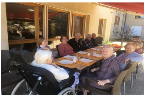
Parc Jean Marc à Villars