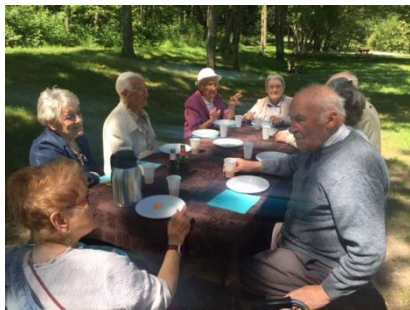
La Roseraie à Saint-Victor-sur-Loire