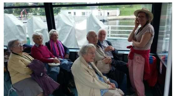
Croisière des gorges de la Loire à Saint-Victor-sur-Loire